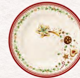
Piatto dessert, stella cadente Ø 21,5 cm 17,90 €