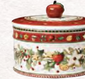
Scatola pasticceria media 11 x 13 cm 44,90 €