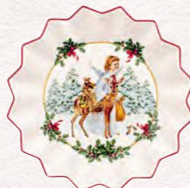
Coppa grande, angelo 24 x 24 x 4,5 cm 19,90 €