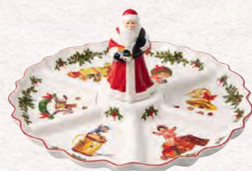
Cabaret Nostalgia 38 x 38 x 20 cm 169,00 €

Con amore e cura abbiamo ricomposto immagini natalizie vintage: la nostra collezione Toy's Fantasy saprà portare il fascino nostalgico del passato nelle vostre giornate invernali. Gli incantevoli motivi della foresta invernale innevata diffondono un'atmosfera calda e intima per suggestive e piacevoli serate con la famiglia e gli amici.