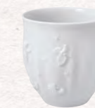
Bicchiere senza manico 250 ml 14,90 €