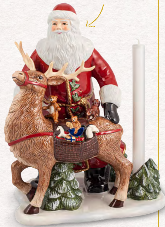
Babbo Natale con cervo 23,5 x 17 x 32 cm 269,00 €

Candele profumate e una casa decorata dall'atmosfera suggestiva. È qui che nascono preziosi ricordi d'infanzia.