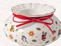
Scatola portacandelina 10 x 6 cm 17,90€