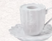
Bicchiere con manico candeliere 10 x 6 cm 14,90 €