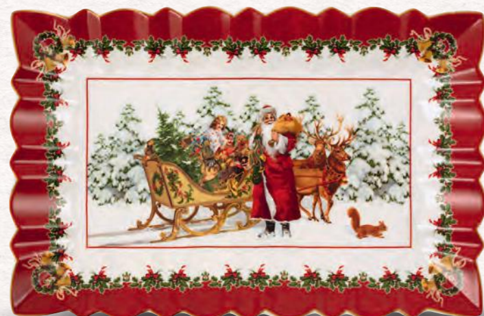
Piatto torta rettangolare, Babbo Natale con slitta 35 x 23 x 3,5 cm 49,90 €