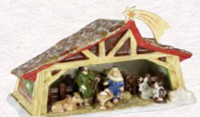
Presepio 27 x 16 x 16 cm 99,00 €