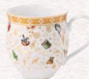
Bicchieri con manico, edizione anniversario 440 ml 19,90 €