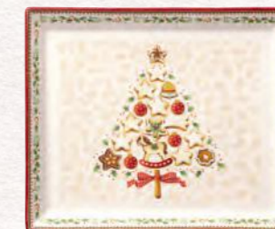
Piatto pasticceria rettangolare piccolo · 27 x 22,5 cm 29,90 €