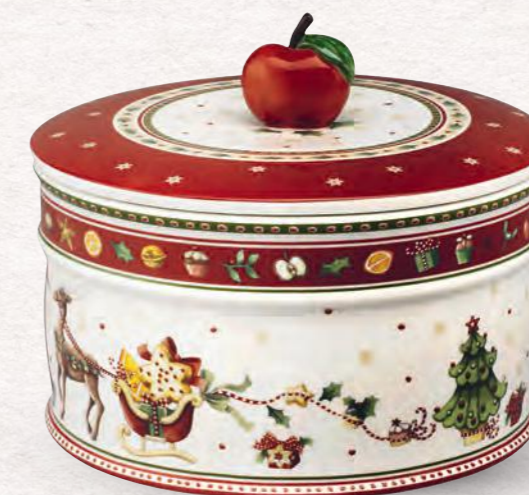
Scatola pasticceria grande 13 x 17 cm 49,90 €