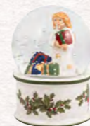
Palla neve piccola 9 x 9 x 9 cm 19,90 €