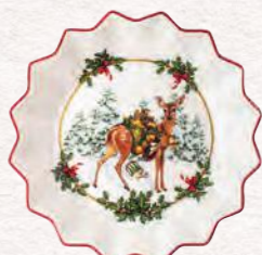
Coppa piccola, cerbiatto con regali 16,5 x 16,5 x 3 cm 14,90 €