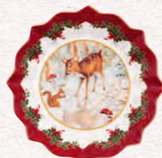
Coppa piccola, cerbiatto 16,5 x 16,5 x 3 cm 14,90 €