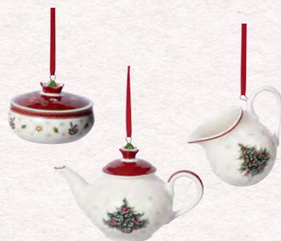
Ornamenti Set da caffè, 3 pz. · 6,3 cm 29,90€