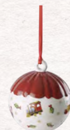
Sfera 6 cm 12,90€