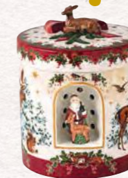
Pacchetto regalo grande 17 x 17 x 20 cm 79,90 €