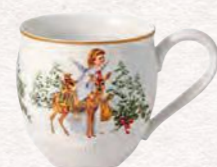
Bicchiere jumbo, angelo 530 ml 19,90 €