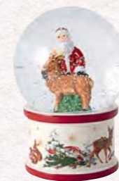
Palla neve grande 13 x 13 x 17 cm 49,90 €