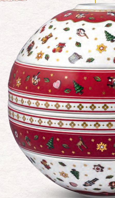
La Boule 24,1 x 21,1 x 23,6 cm 299,00 €