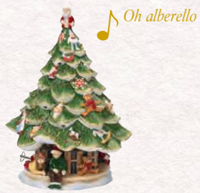
Albero di Natale grande con bambini 30 cm 169,00 €