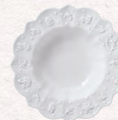
Piatto fondo Ø 23,5 cm 23,90 €