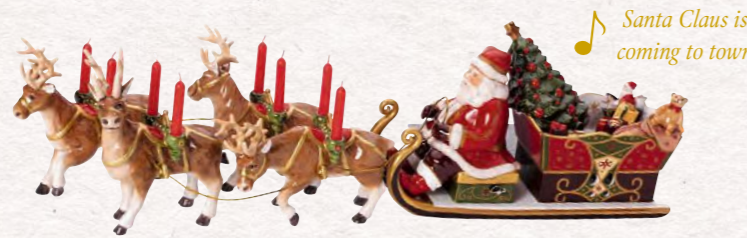
Giro in slitta di Babbo Natale 22 x 70 x 16 cm 279,00 €