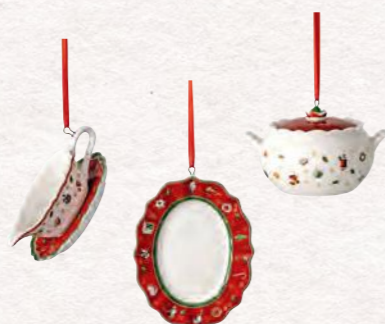
Ornamenti articoli per servire, set 3 pz. · 3 x 6 cm 29,90€