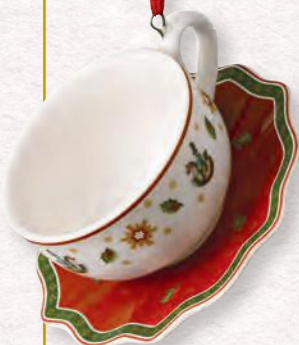
Ornamenti set stoviglie rosso, 3 pz. · 4x7 cm 29,90€