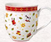
Mug 440 ml 19,90 €