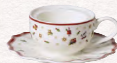
Portacandelina tazza da caffè · 9,8 x 9,8 x 4 cm 14,90€