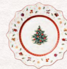
Piatto colazione bianco Ø 24 cm 19,90 €