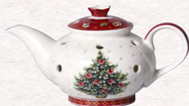
Portacandelina bricco da caffè 16 x 9,5 x 9 cm 23,90€