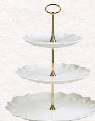
Alzata 29,5 x 34 cm 119,00 €