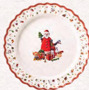
Piatto di portata Ø 45 cm 94,90 €

Anche "La Boule", la nostra icona del design, si fa bella in tono con il decoro festivo e giocoso di Toy's Delight, creando un elegante connubio fra tradizione e modernità.