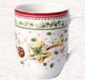
Bicchiere con manico, stella cadente 340 ml 17,90 €