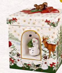
Pacchetto regalo grande quad. 16 x 16 x 20 cm 79,90 €