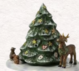
Albero di Natale con animali del bosco · 9 x 9 x 16 cm 59,90 €