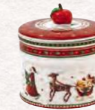
Scatola pasticceria piccola 12 x 11 cm 29,90 €