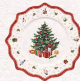
Segnaposto Ø 35 cm 39,90 €