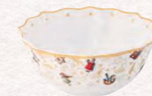
Coppa, edizione anniversario Ø 15 cm 17,90 €