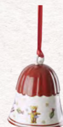
Campana 7 cm 12,90€