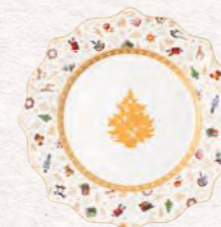
Piatto dessert, edizione anniversario Ø 24 cm 19,90 €