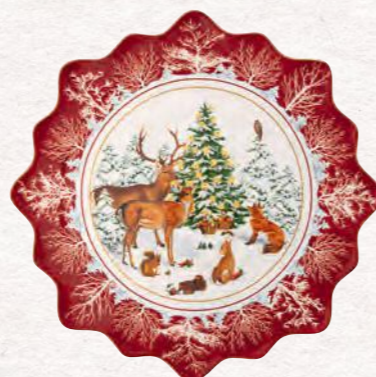
Piatto pasticceria grande, animali bosco 42 x 42 x 2 cm 69,90 €