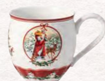
Bicchiere jumbo, Babbo Natale con animali bosco · 530 ml 19,90 €