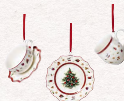
Ornamenti Servizio da tavola, 3 pz. · 6,3 cm 29,90€