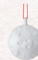
Sfera 6,5 x 7,5 cm 12,90 €