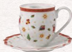
Bicchiere con manico candeliere · 10 x 6 cm 14,90€