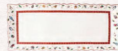
Piatto torta rettangolare 39 x 16 cm 49,90 €