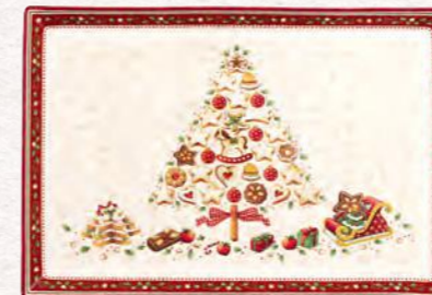
Piatto pasticceria rettangolare grande · 39 x 26,5 cm 49,90 €