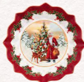
Coppa grande, Babbo Natale e albero · 25 x 25 x 4 cm 19,90 €