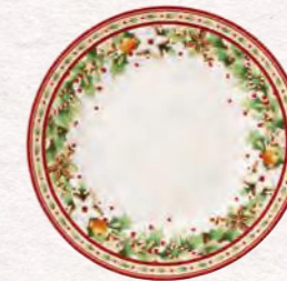
Piatto dessert Ø 21,5 cm 17,90 €