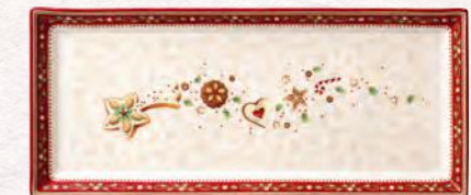
Piatto dolci 39 x 17 cm 49,90 €