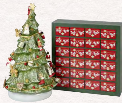
Calendario dell'Avvento 3D albero 25 x 32 x 43 cm 349,00 €