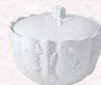
Scatola pasticceria 20 x 15 cm 49,90 €