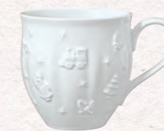
Bicchiere con manico, grande 500 ml 19,90 €